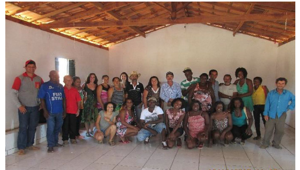
Japonvar - Visita à COOPERJAP