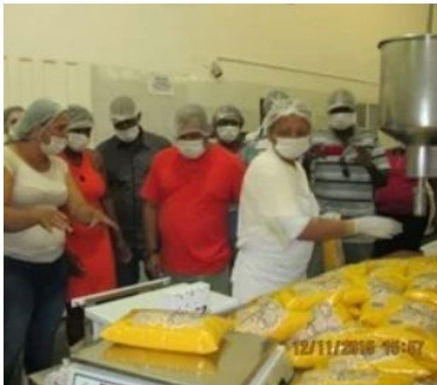
Montes Claros - Cooperativa Grande Sertão, onde o grupo de Pontinha acompanhou o beneficiamento de pequi

Intercâmbios de comunitários em cooperativas do Norte de Minas, incentivando o trabalho coletivo, o sentimento de pertencimento, autonomia e reconhecimento social