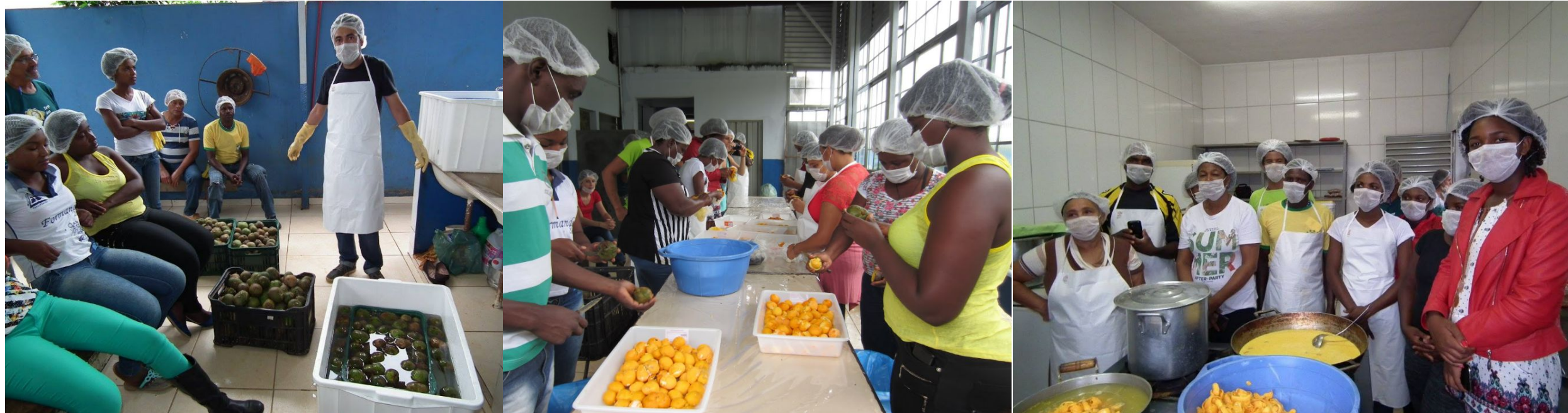
Oficinas sobre manejo, processamento e higiene